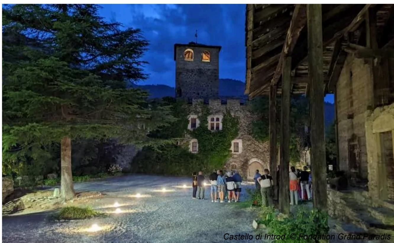
Castello di Introd.

La fruizione del Castello è affidata a Fondation Grand Paradis che propone un ricco programma per la stagione estiva